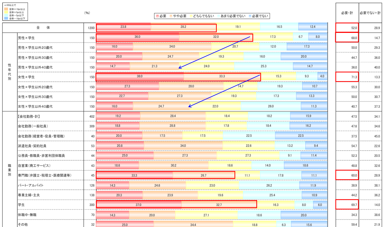
〈図1〉現在、または将来のことを考えたとき、あなたにとって英語力は必要だと思いますか。

◆自主調査レポートの続きはこちらへ⇒ http://www.cross-m.co.jp/report/en20131216/