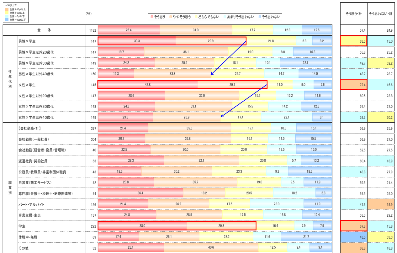
<図3> あなたは将来、グローバルに働きたいとお考えですか。(SA)